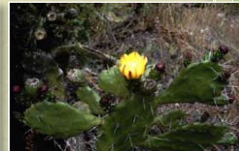
Figuière de Barbarie